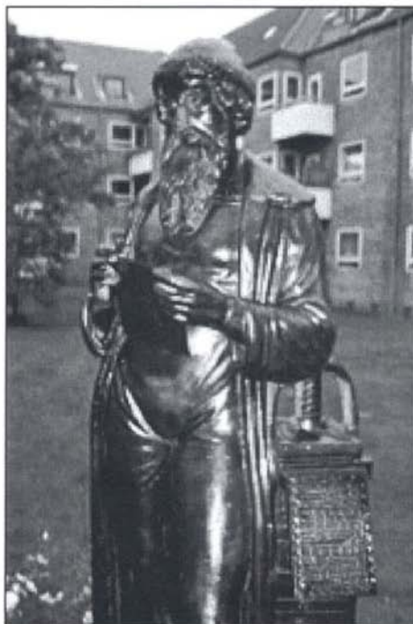
Statue af Gutenberg i Provstegården.

Nu sidder jeg så her som formand og skal se fremad mod det næste jubilæum. Jeg skal være ærlig og sige, at det bliver jo ikke