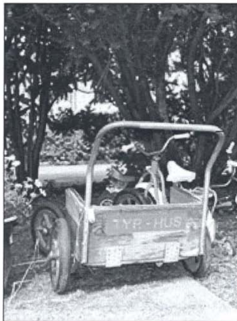
Børn på besøg i Typografernes Hus kan låne et køretøj.

Der var nu etableret moderne Nyborg-møntvaskerier i begge ejendomme.